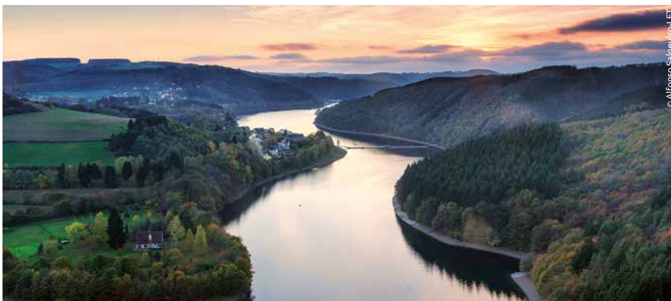
Le lac de la Haute-Sûre.